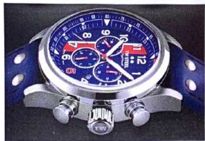
TW STEEL NIGEL MANSELL RED 5 CHRONOGRAPH £399.95