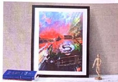
ASTON MARTIN DBR1/300 Le Mans 1959 Winner, £195