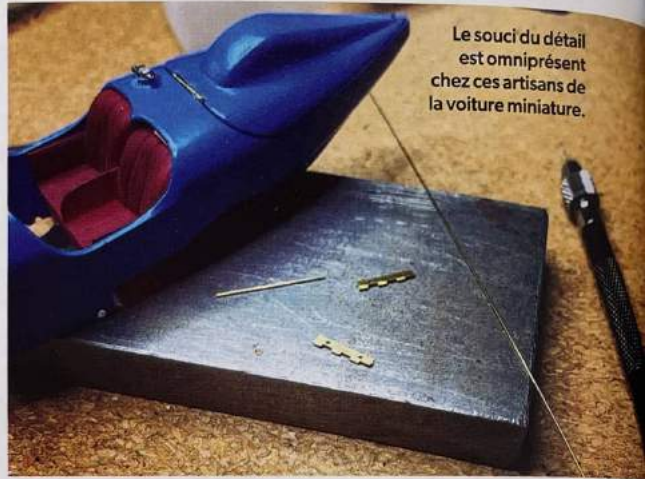
Le souci du détail est omniprésent chez ces artisans de la voiture miniature.